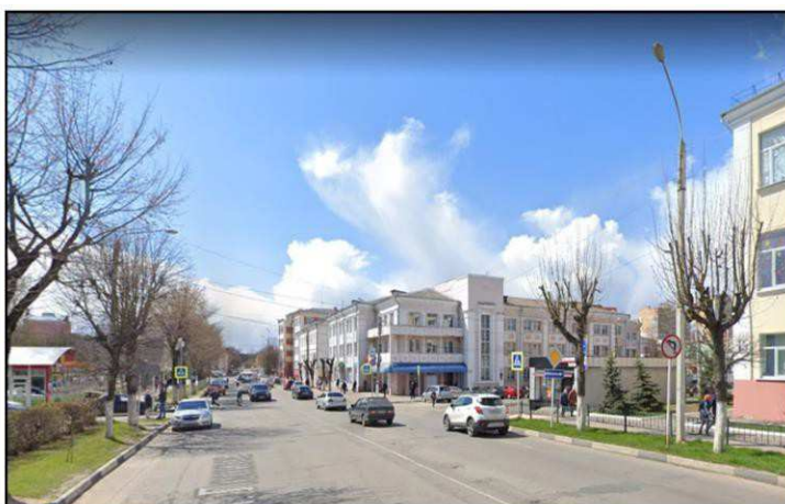
Дальняя точка восприятия с просп. Ленина на запад