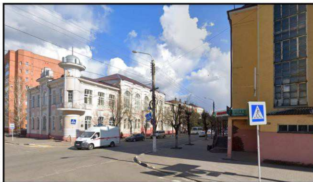
Дальняя точка восприятия с ул. Октябрьская на юг