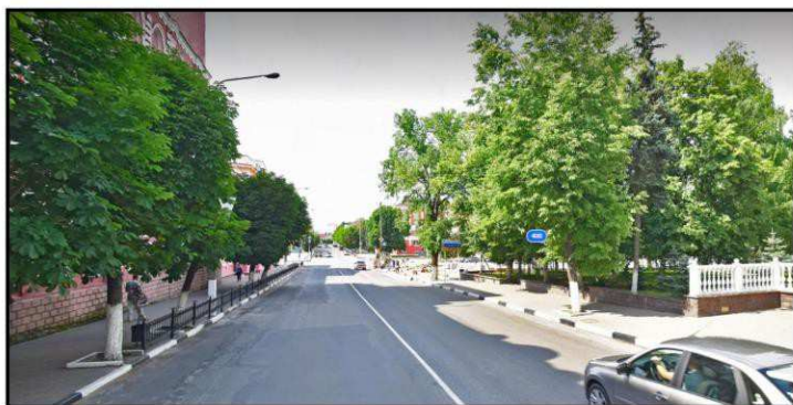
Дальняя точка восприятия с ул. Октябрьская на север