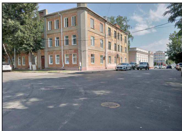
Дальняя точка восприятия с просп. Ленина на восток