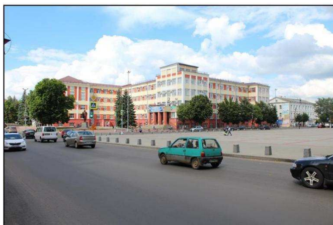
Точка оптимального восприятия Объекта